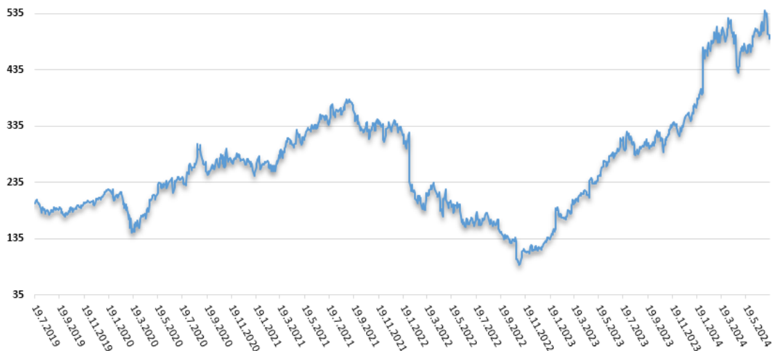
Vývoj ukazovateľa P/E v 3 ročnom horizonte