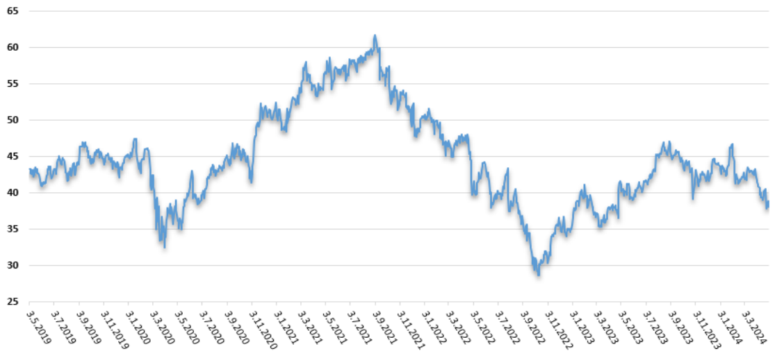
Vývoj ukazovateľa P/E v 3 ročnom horizonte